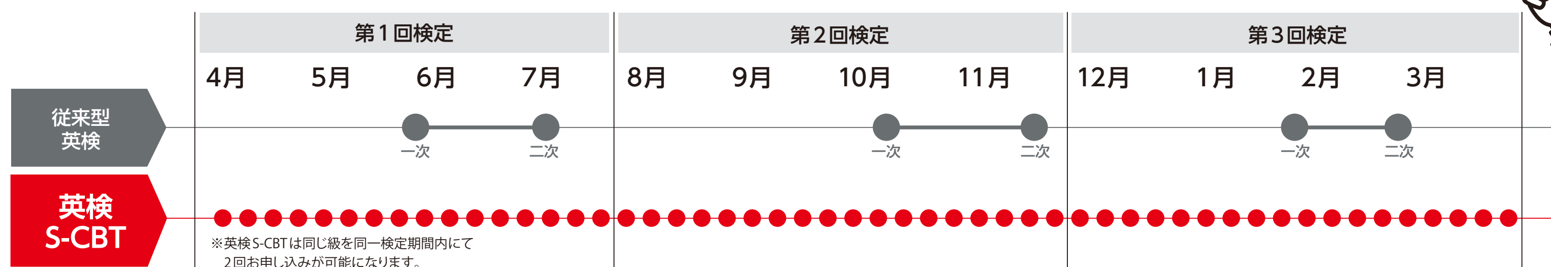
スケジュールイメージ

「英検S-CBT」は原則毎週土日に試験日を設定。自分の予定に合わせて柔軟に受験日を選択できます。